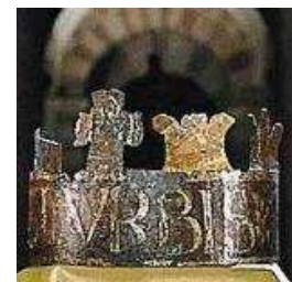
Im Dom zu Speyer

Am kommenden Sonntag (20.02.) führt uns unsere erste Fahrt im Jahr 2011 nach Speyer an den Rhein. Sie können dort während des fünfständigen Aufenthalts entweder das Technik Museum (pro vorgelegter Fahrkarte der HE erhalten die Besucher dort übrigens ein wertvolles Buchgeschenk im Wert von € 10,00) oder das Meerwasseraquarium Sealife besuchen oder an einem geführten Stadtrundgang teilnehmen. Die Fahrgastinformation zu dieser Fahrt ist ab heute online. Der Zug ist für die Fastnachtzeit überraschend gut gebucht. Für Kurzentschlossene gibt es aber noch genügend Plätze in der 2. und (neu) 3. Wagenklasse (die erste Klasse ist seit