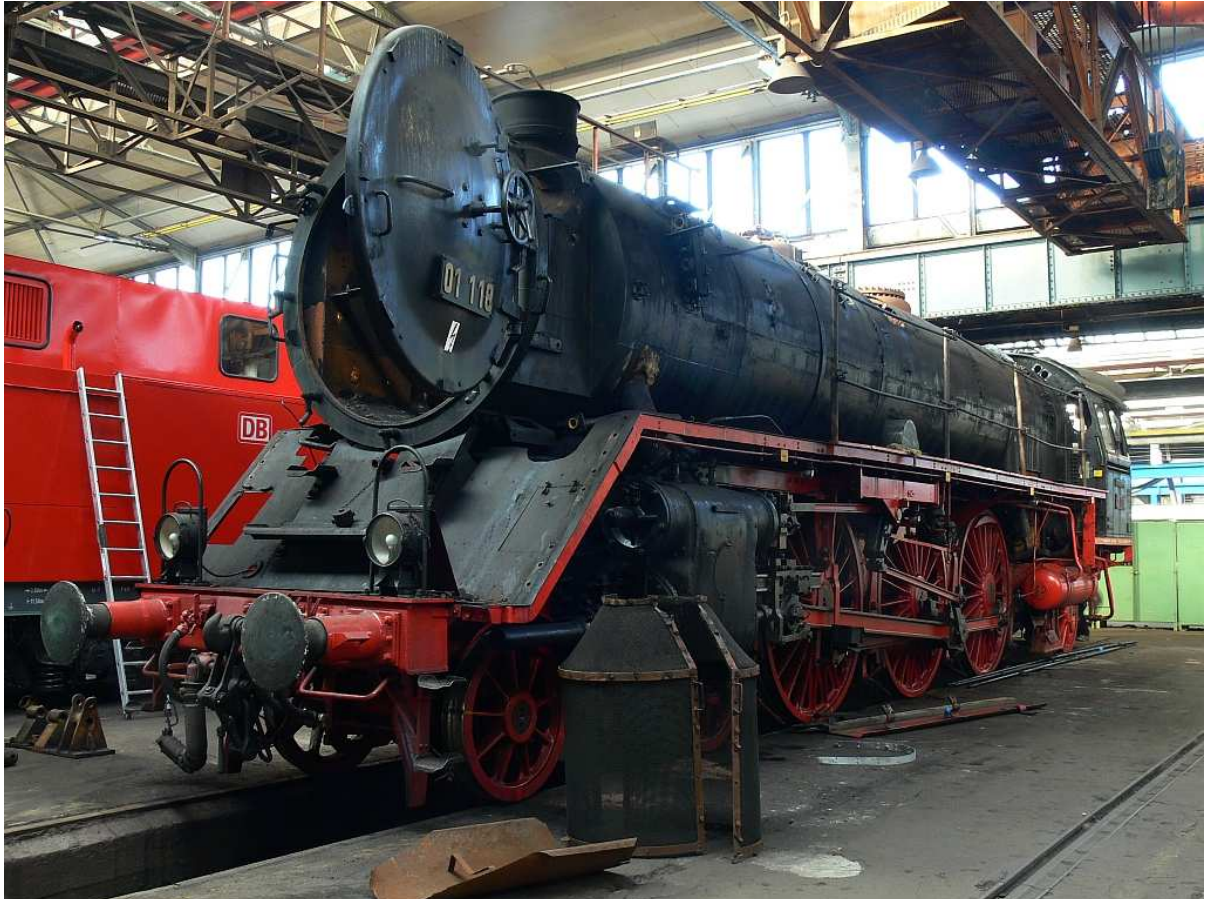
01 118 im DLW Meiningen

Lok 01 118 wird derzeit im Dampfloswerk Meiningen (DLW) einer planmäßigen Kesseluntersuchung unterzogen, bei der auch die Heiz- und Rauchrohre komplett erneuert werden. Die Demontagearbeiten haben begonnen, noch im Februar wird der Kessel vom Fahrgestell abgehoben und befundet, so dass eine endgültige Festlegung der notwendigen Arbeiten stattfinden kann. Es ist geplant, die Lok rechtzeitig vor Pfingsten 2011 fertig zu stellen, damit eine Einsatz nach Neuenmarkt-Wirsberg mit Befahren der Schiefen Ebene, alternativ des Bayrischen Bier- und Bäckereimuseums sowie der Mönchshof-Braugaststätte, beides in Kulmbach, durchgeführt werden kann. Auch der Einsatz an Pfingsten auf der Frankfurt-Königsteiner-Eisenbahn ist vorgesehen. Der Kessel hat dann eine weitere Frist von 3 plus 1 Jahren.