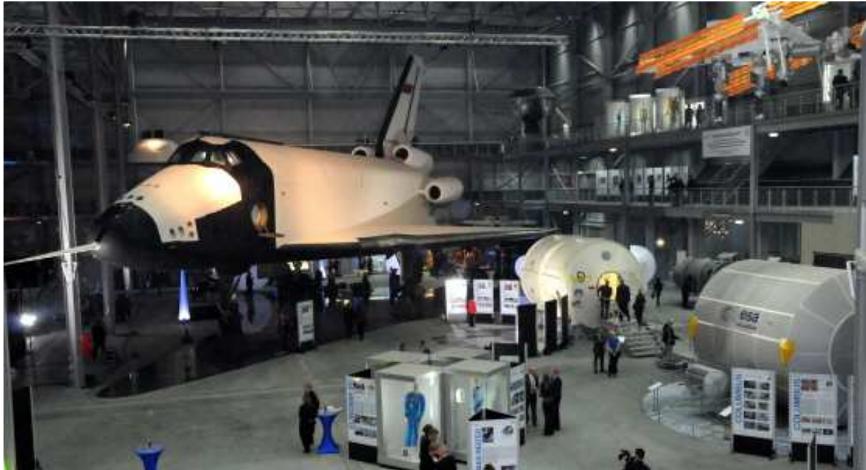
Raumfahrtabteilung im Technik Museum Speyer

Sealife: Um 15 Uhr können Sie miterleben, wie der Oktopus gefüttert und zum Spielen animiert wird.