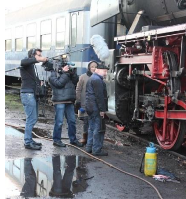
Die Hessenschau begleitet den Dampfsonderzug „DER MICHELSTÄDTER“ vom Anheizen bis zur Rückkunft