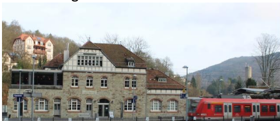
Bahnhofsfest auch in Eppstein am 09. Juli 2016

Unbedingt vormerken sollten Sie sich den Samstag, 09. Juli 2016 . Aus Anlass des Abschlusses der Arbeiten am barrierefrei umgebauten Stadtbahnhof Eppstein pendelt ein Dampfsonderzug der HEF mehrmals von Frankfurt Süd kommend zwischen Hofheim (Ts), Eppstein (Ts), Niedernhausen und Idstein . Fahrkarten erhalten Sie im Zug oder bereits heute über unseren digitalen Fahrkartenschalter.