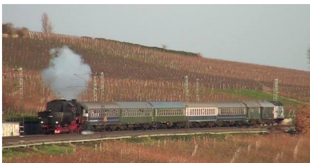
Adventszüge der HEF oder im Auftrag bei Aurich, Erbach und Igstadt

Auch waren wir wieder einmal Gast in der Hessenschau. Ein Reporter Team des Fernsehens des hr begleitete unseren Dampfsonderzug „Der Michelstädter“ vom Anheizen der Lok über die Vorbereitungen, die Abfahrt im Südbahnhof bis hin zur Ankunft in Michelstadt und zurück ins Depot.