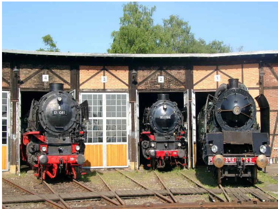
Impressionen vom Gelände des SEH

Während 01 118 den Sonderzug wegran- giert, werden Sie mit "Donnerbüchsen" und einer Diesellok direkt im Bahnhof ab- geholt und in das Süddeutsche Eisen- bahnmuseum" (SEH) gebracht, wo nach kurzer Zeit auch 01 118 einrückt, um auf die Rückfahrt vorbereitet zu werden. Der dortige Eisenbahnverein hat ein kleines Besuchsprogramm für seine Gäste aus