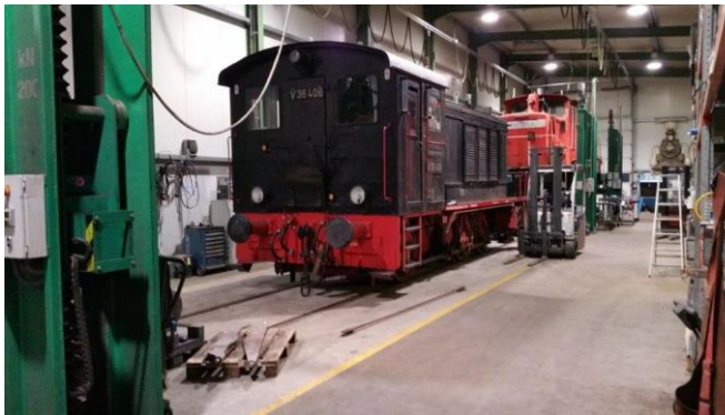
Lok HEF V36 406 zur Aufarbeitung bei der Firma InfraServ, Wiesbaden.

hat man im Jahre 1976 untaugliche Teile verbaut. Die Lok zieht damit Verbrennungsluft nicht nur durch die Filter, sondern auch direkt aus der Umgebungsluft an. Die Folge sind Riefen in den Laufbuchsen, da auch der Schmutz der Umgebungsluft in die Brennräume gelangt. Hier müssen also noch konstruktive Veränderungen erfolgen, damit der Motor nicht noch mehr Schaden nimmt.